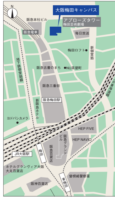
関西学院大学 大阪梅田キャンパス 阪急梅田駅茶屋町口下車北へ徒歩5分 大阪市北区茶屋町19-19 アプローチタワー10階・14階 TEL.06-6485-5611 http://www.kwansei.ac.jp/kg_hub/access/