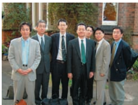
写真9 2003年7月 フォーラムKGP M創設にかかわった主要メンバーによるイギリス自治体の行政視察にて