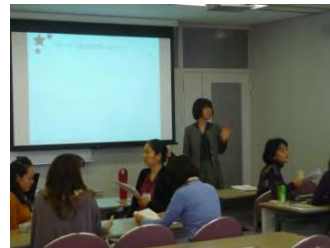
グループワーク中心の授業