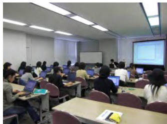
ITスキルのブラッシュアップ

プログラムでは、キャリアデザインを描くことから始め、企業が即戦力として求めるコミュニケーション力、モチベーション・マネジメント、時間管理術から、経理・営業・管理などの専門的なスキルまで身につけ、再就職や職場復帰へのサポートを行います。一生付き合える仲間との出会い、働く女性のネットワークを作る修了生との交流なども盛んで、積極的に自らのキャリアを考え構築できる環境を提供しています。