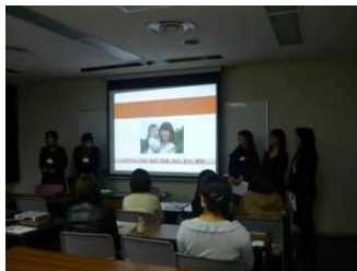
プレゼンスキルの養成